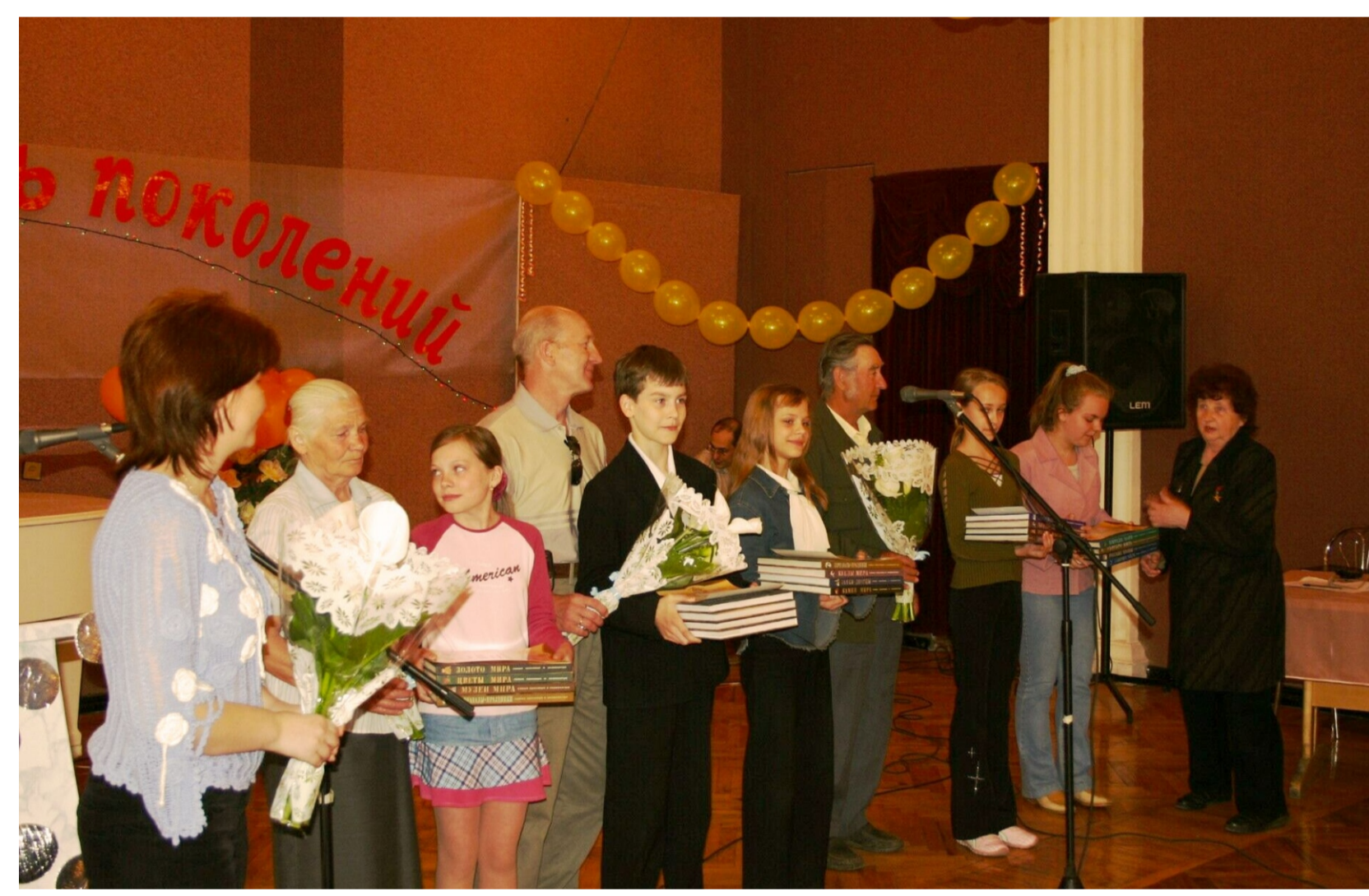
Награждение победителей конкурса «Жемчужная нить поколений». 2001 г.