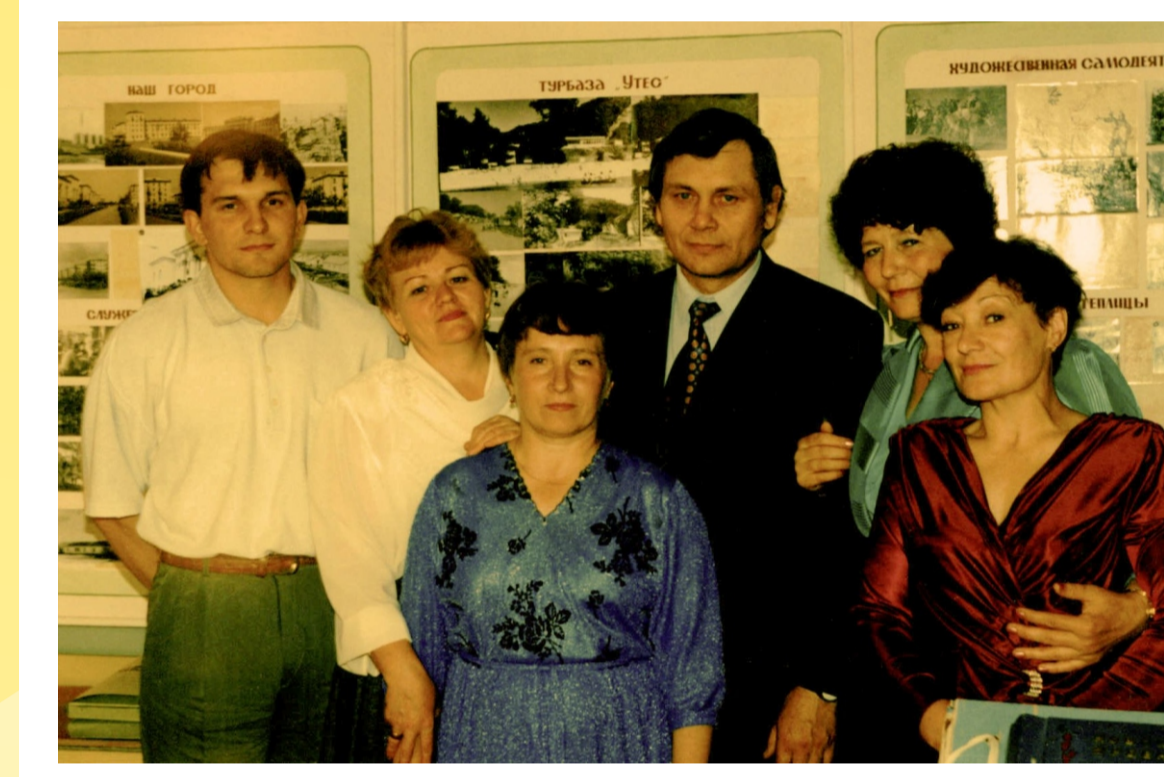
Победители конкурса «Лучший по профессии» в музее. 1997 г.