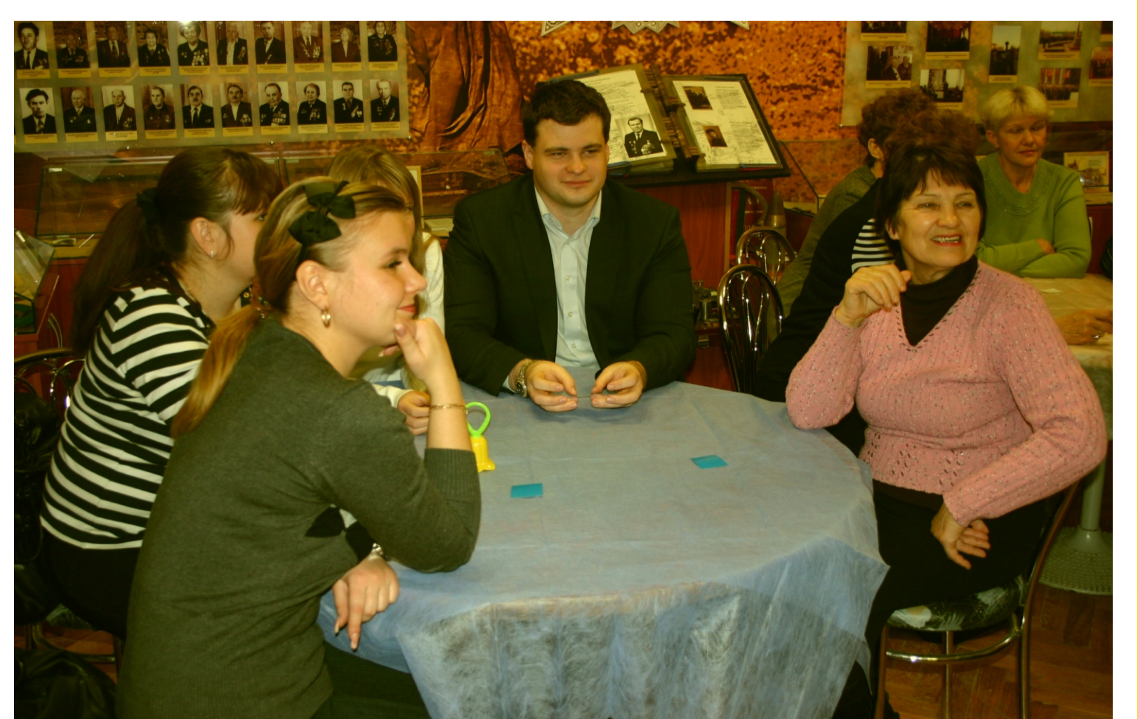
Встреча молодых специалистов с ветеранами завода. Игра «Это было недавно, это было давно». 2012 г.