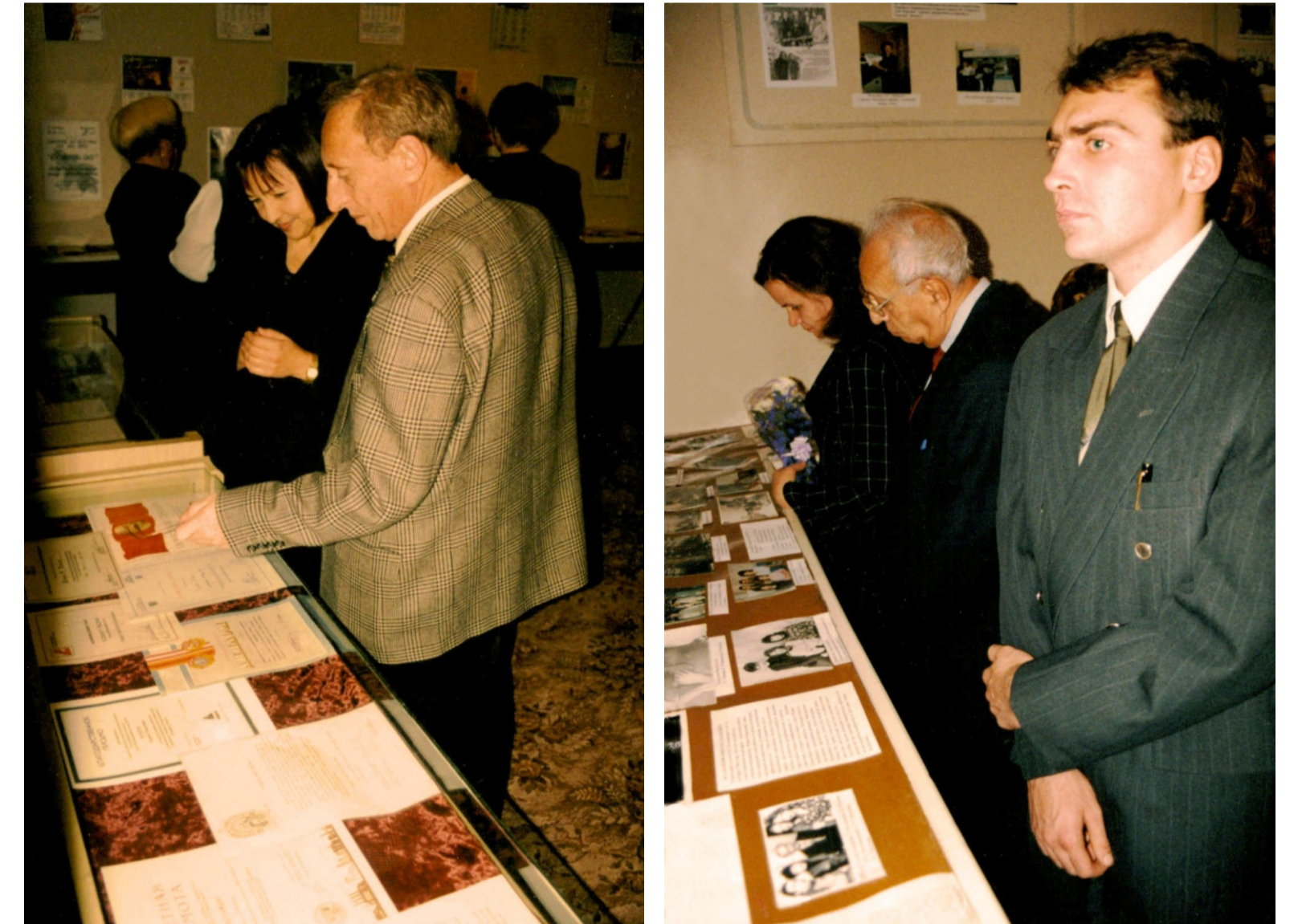
На открытии выставки, посвященной 40-летию газеты «За передовую технику». 1999 г.