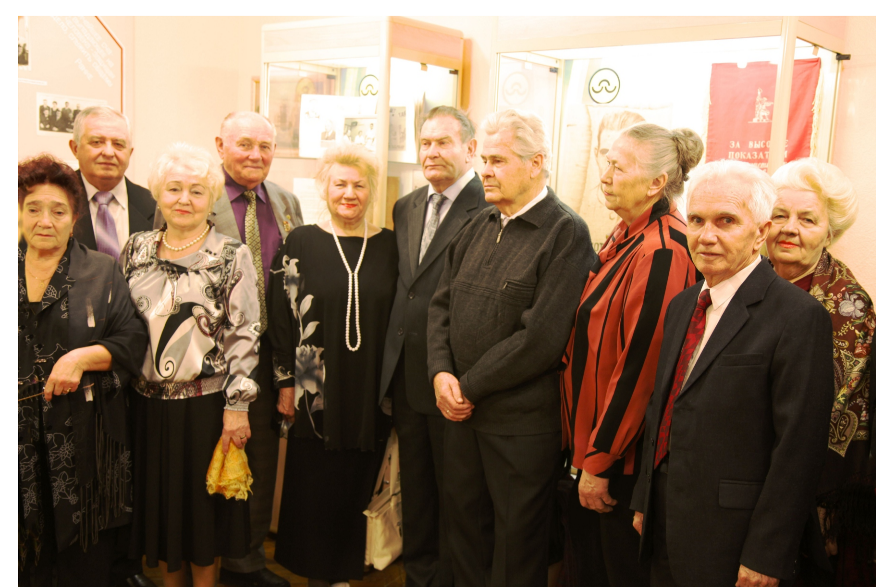
Ветераны завода в музее