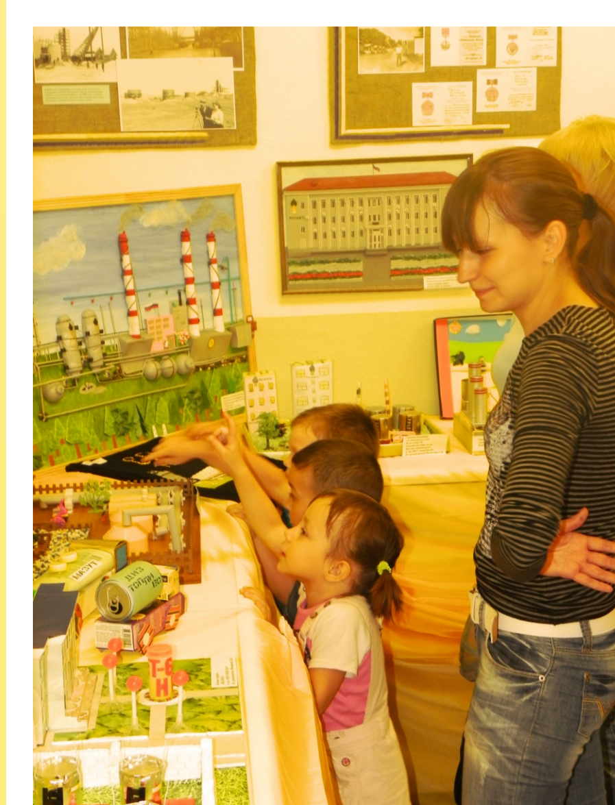
Выставка декоративно-прикладного творчества «Заводской мой край»