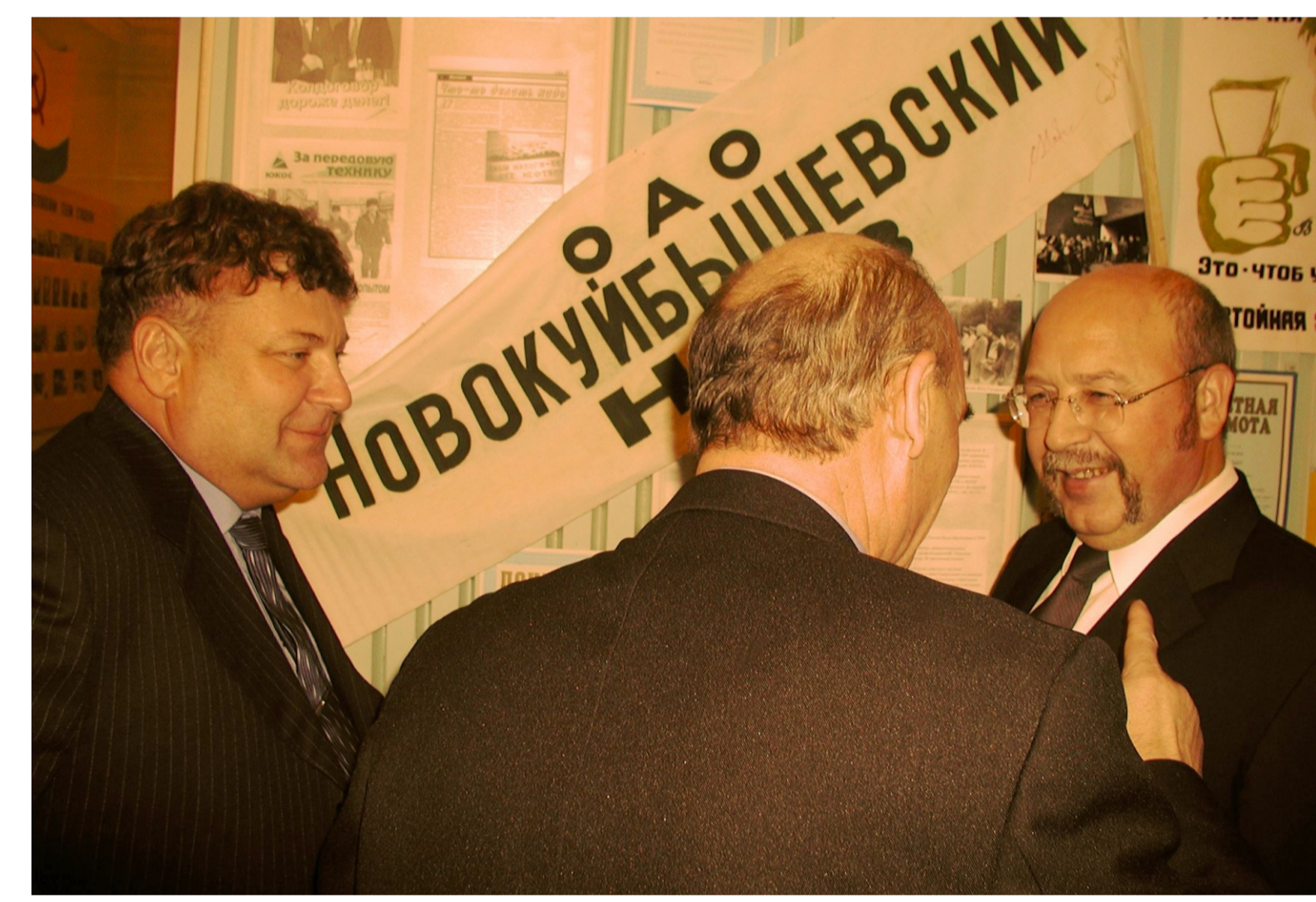
На выставке, посвященной 50-летию ОПО ОАО «НК НПЗ». 2002 г.