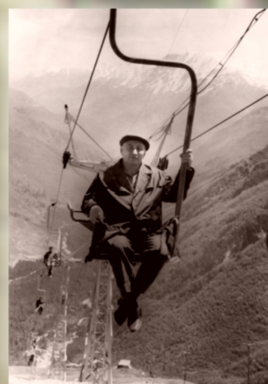
На пути к станции на горе Эльбрус. 1974 год