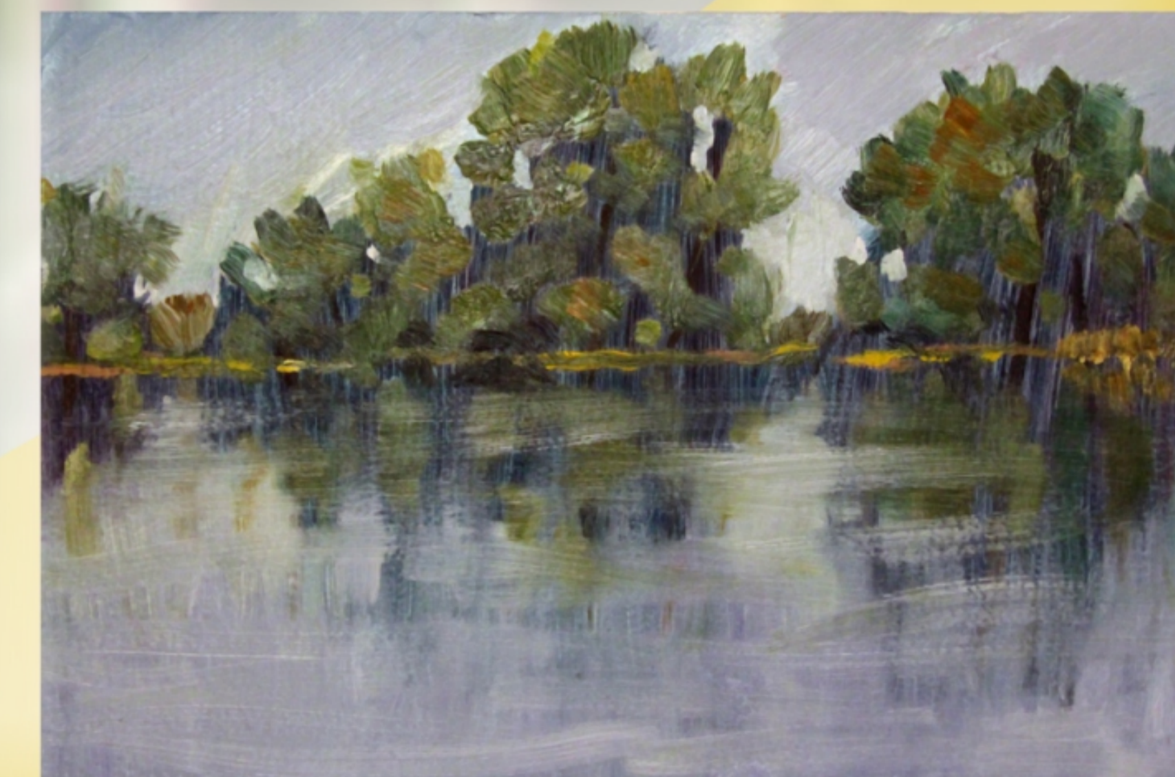
Живописные работы Н.М. Герасименко