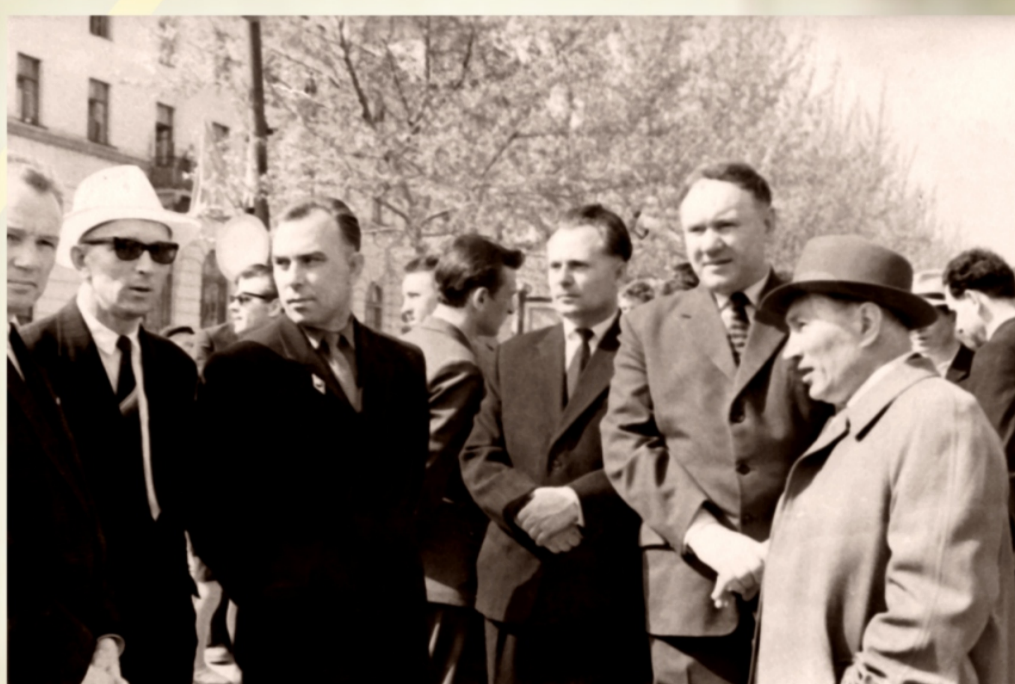
На Первомайской демонстрации. 1962 год