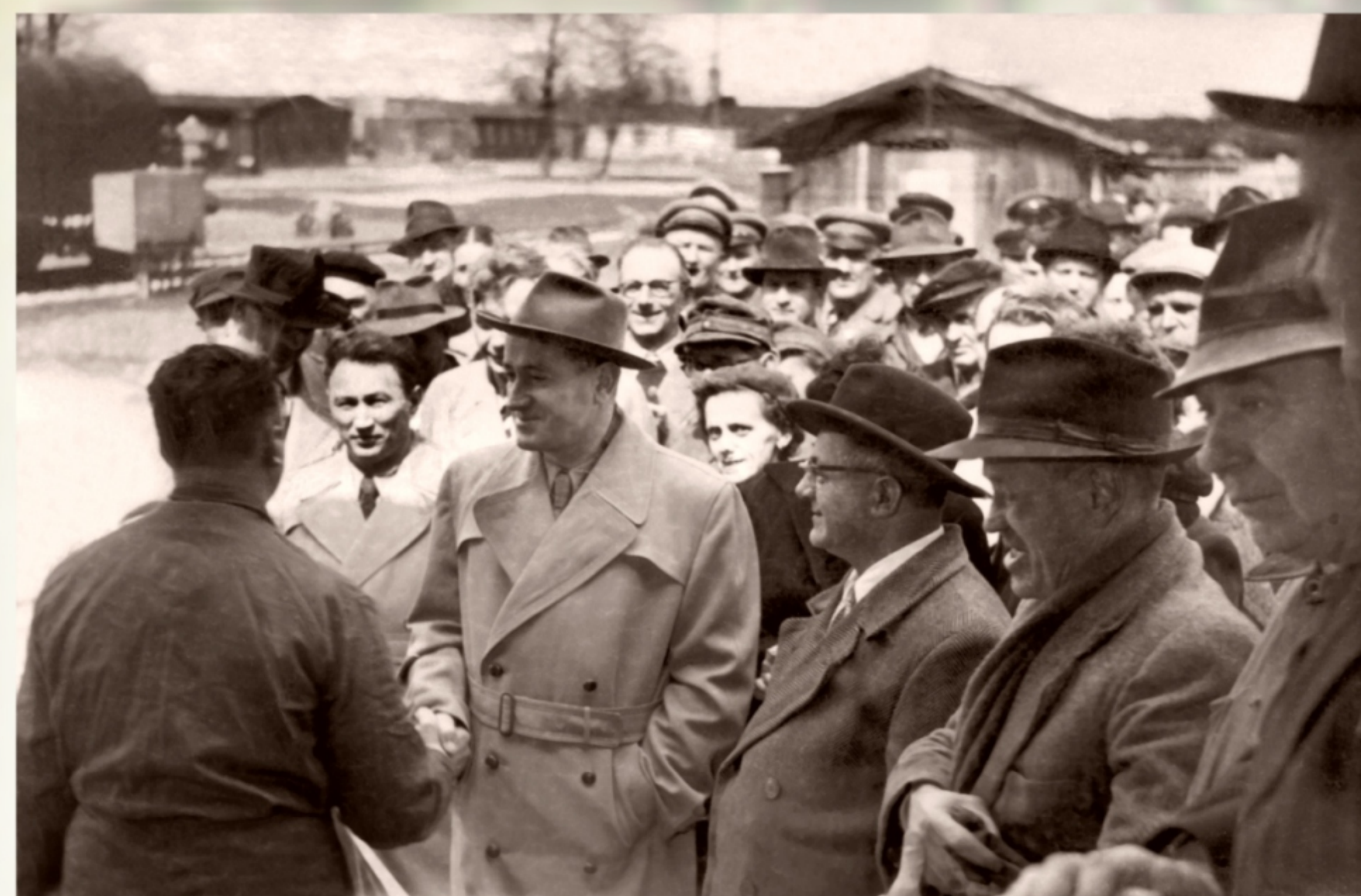
На одном из заводов в Вене 1954-1955 гг.