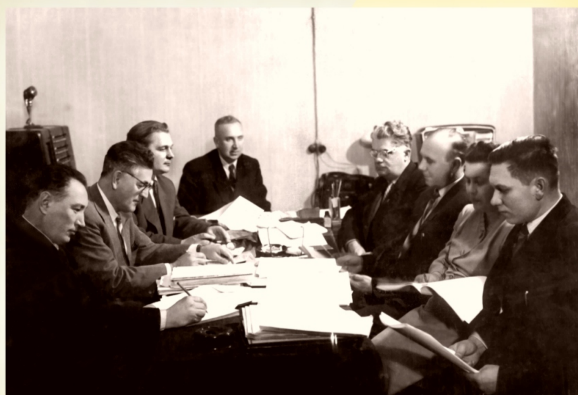
На совещании в «Гипрвоокнефти». Куйбышев, 1957 год