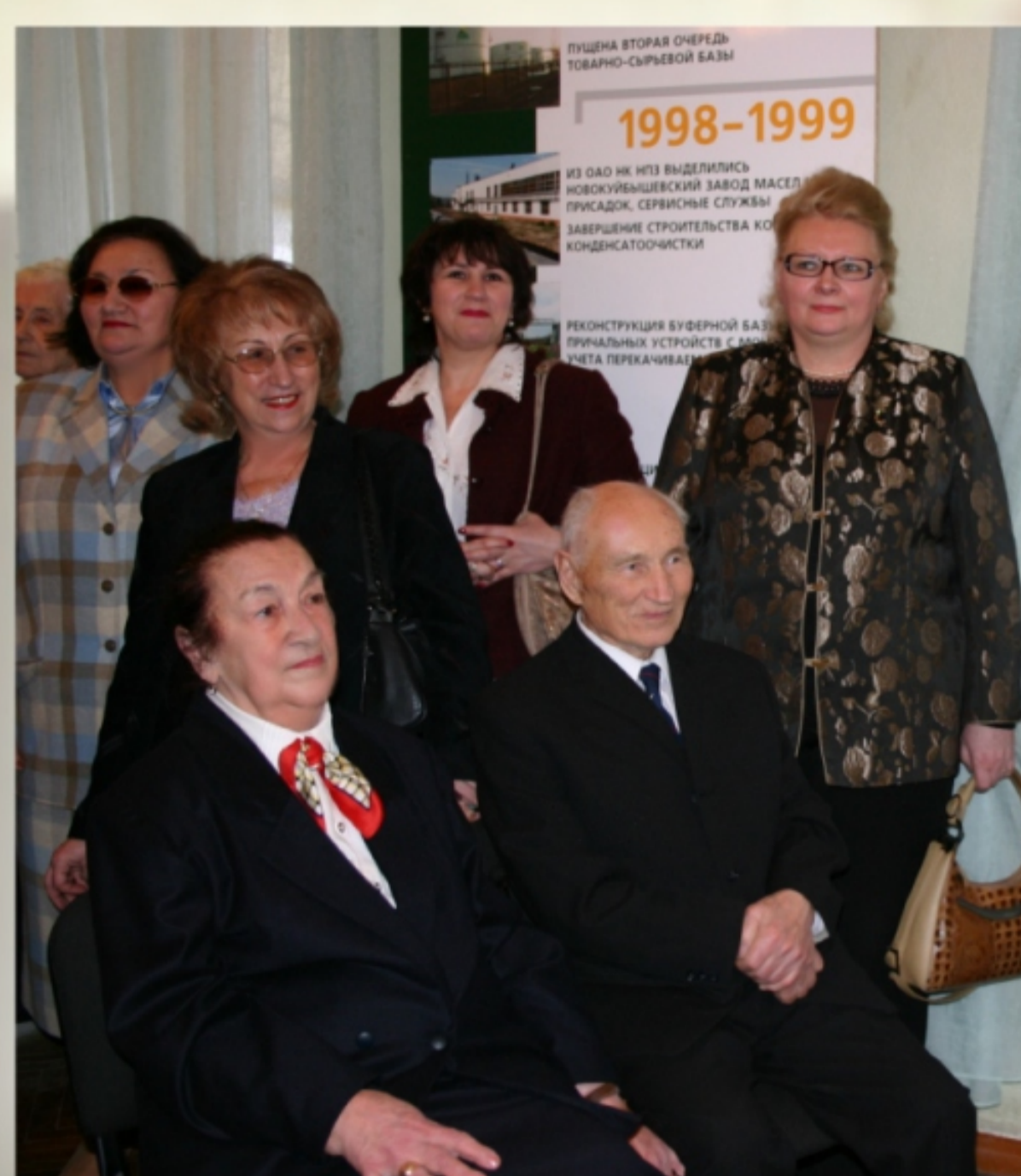
В музее Трудовой Славы ОАО «НК НПЗ». 2004 год