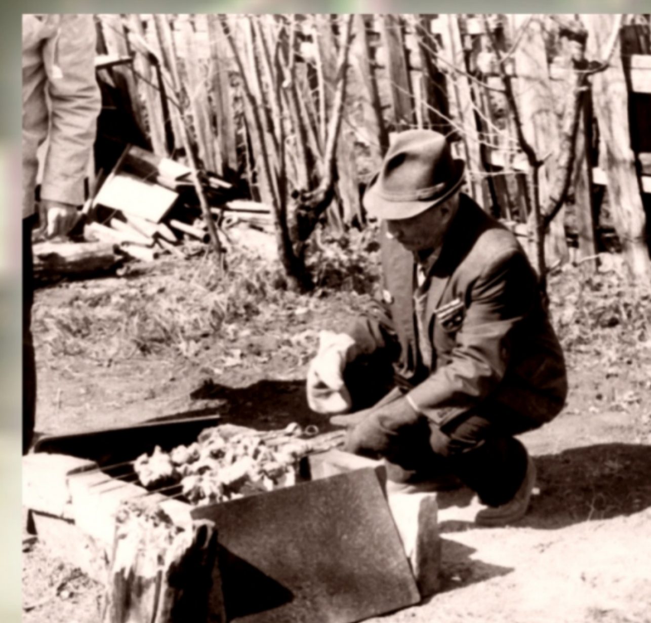
За приготовлением шашлыка. 1974 год