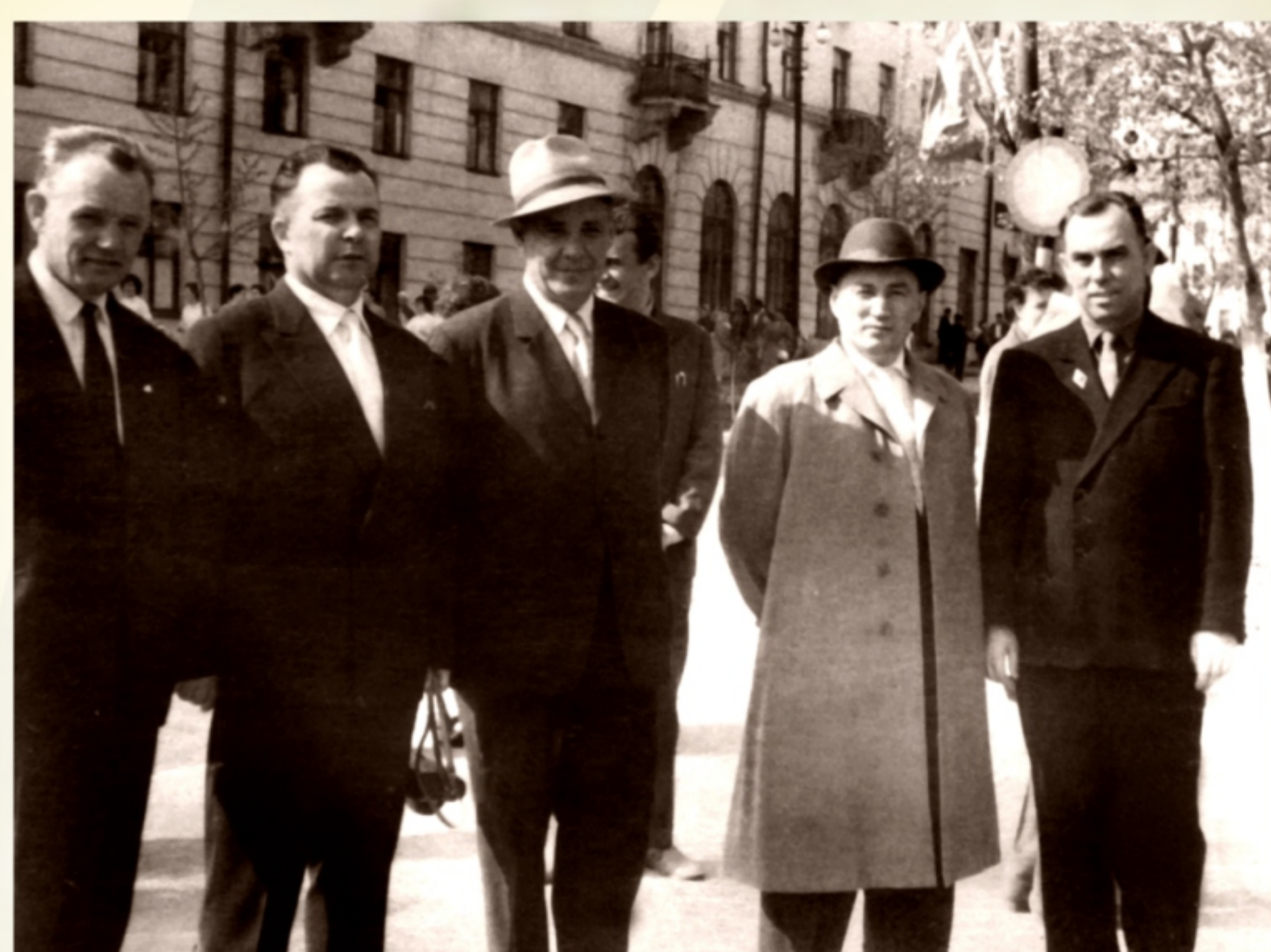
На Первомайской демонстрации. 1962 год