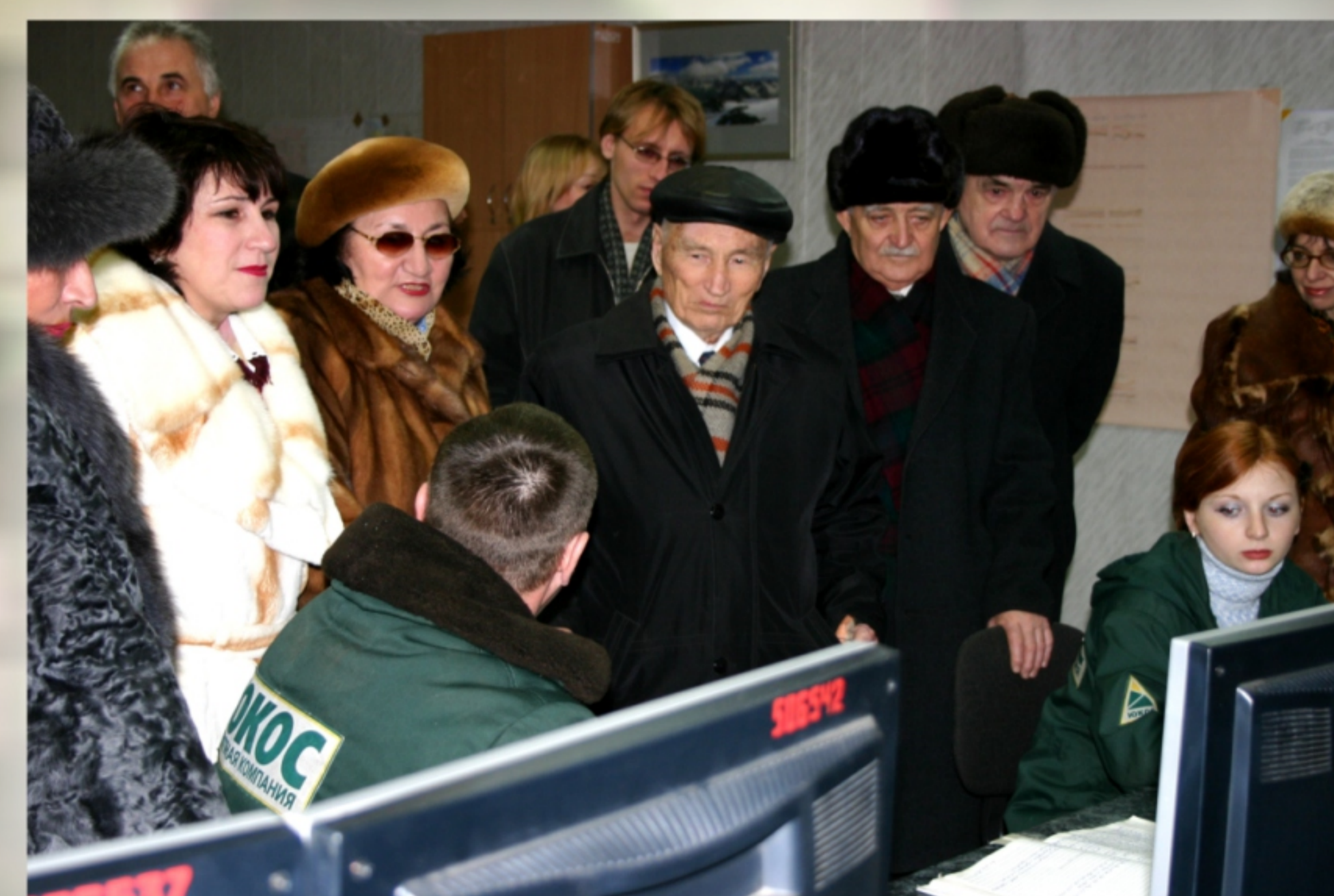
На экскурсии по Новокуйбышевскому НПЗ. 2004 год