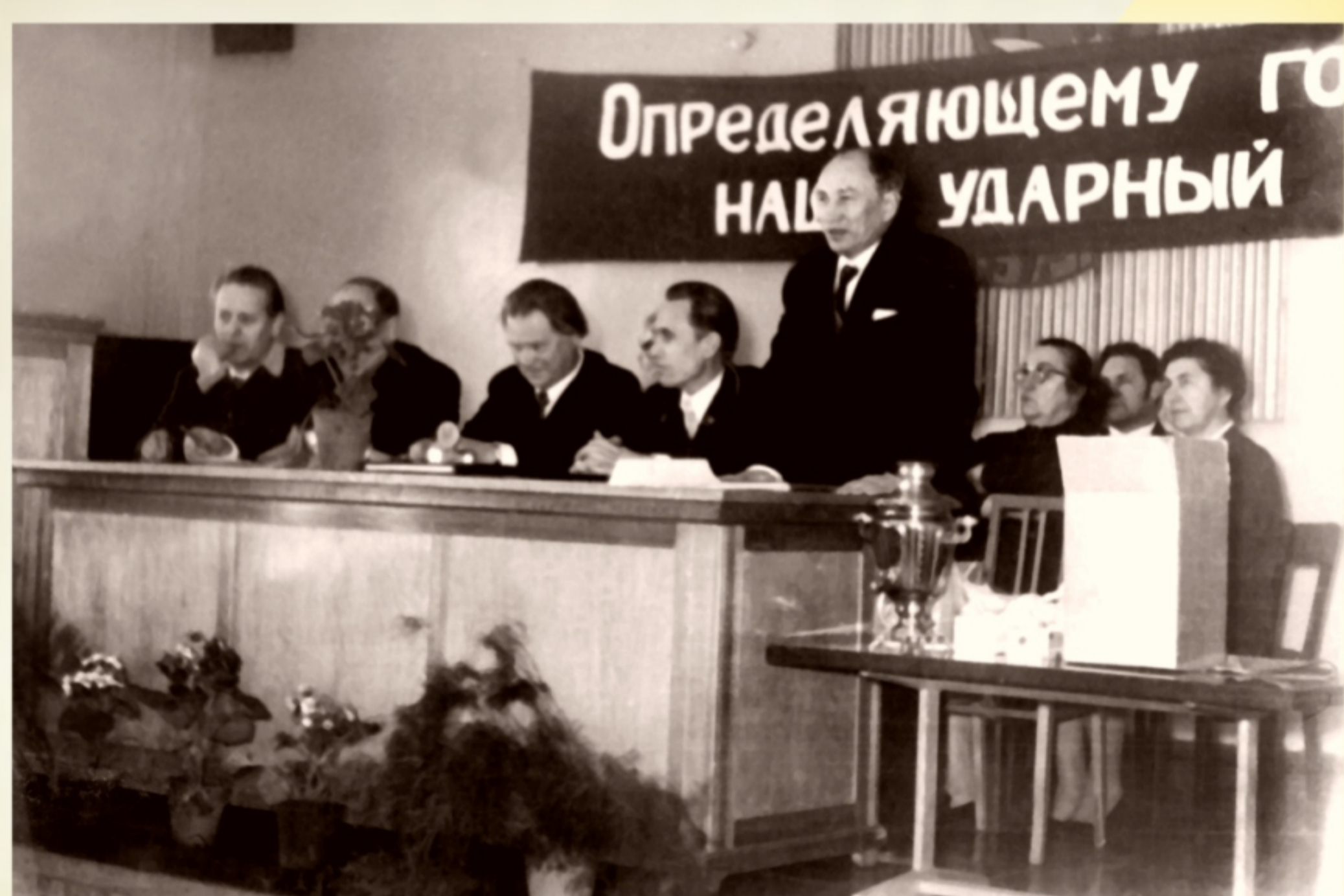
Совещание в ВНИИ НП