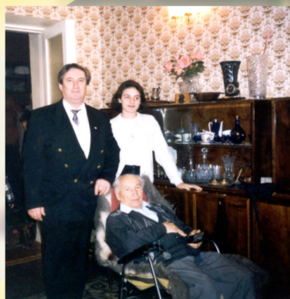
В семейном кругу. 1992 год