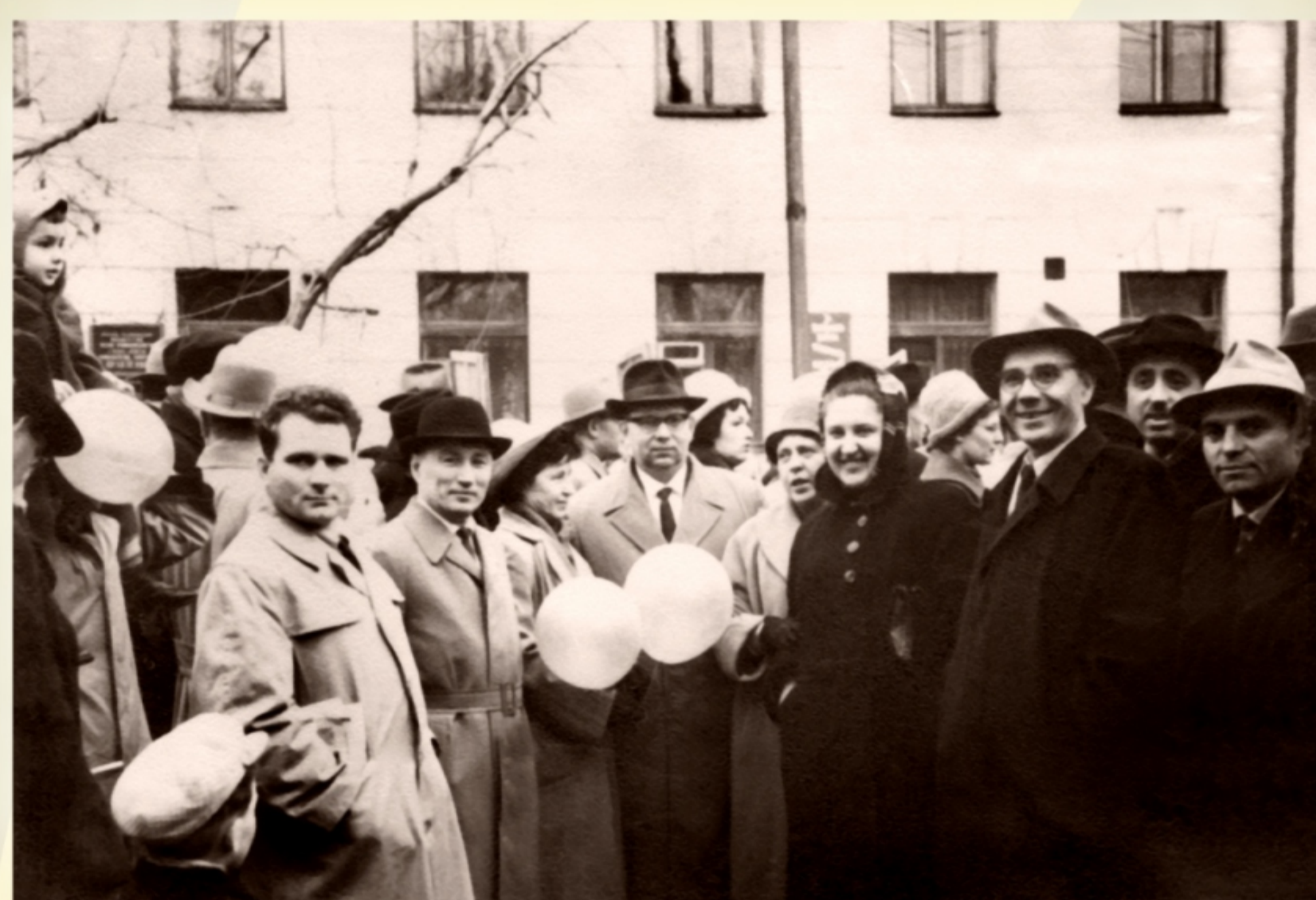
Ноябрьская демонстрация. 1961 год